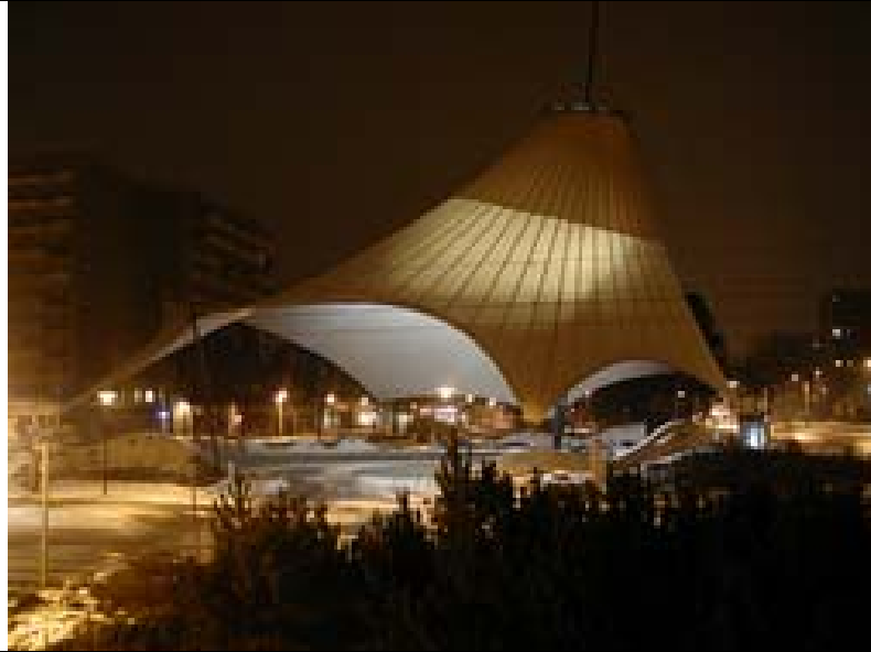
Zelt (2001), Cottbus-Sachsendorf

Dieses Zelt wurde kürzlich im ehemaligen – so muß man sagen, weil inzwischen fast alle Geschäfte geschlossen sind – Zentrum einer komplexen Plattensiedlung in Cottbus Sachsendorf mit hohem finanziellem Aufwand (man spricht von 700.000 Euro) gebaut. Klar, die Plattensiedlung Sachsendorf, in der vor der Wende ungefähr 25.000 Menschen gelebt haben, hatte ca. 1/3 seiner Einwohner verloren, und man muß und will ja auch etwas tun.